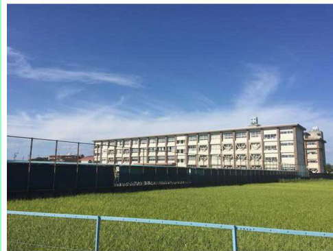
一宮市立千秋中学校