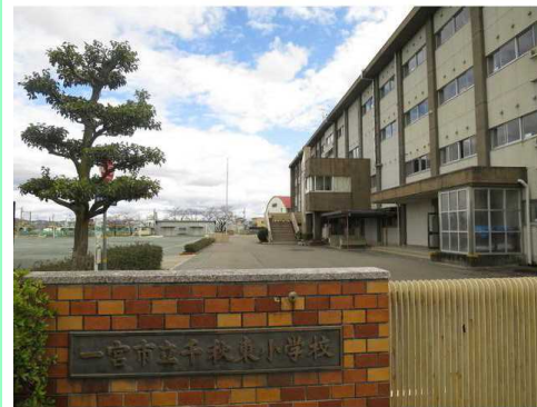
一宮市立千秋東小学校