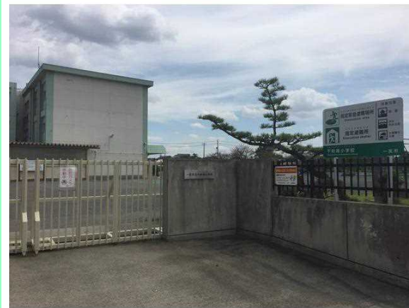
一宮市立千秋南小学校