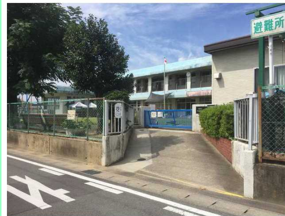
一宮市立千秋南保育園