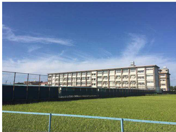
一宮市立千秋中学校