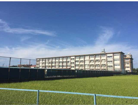
一宮市立千秋中学校