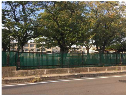
一宮市立千秋小学校