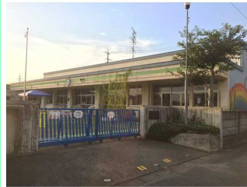
一宮市立千秋北保育園