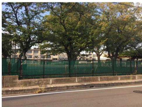
一宮市立千秋小学校