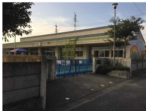
一宮市立千秋北保育園