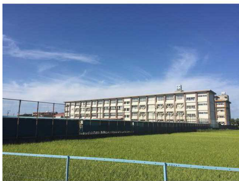
一宮市立千秋中学校