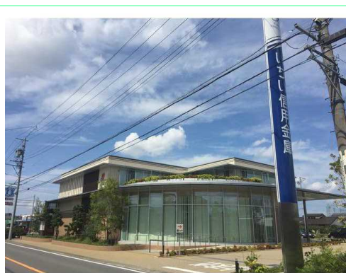
いちい信用金庫千秋支店