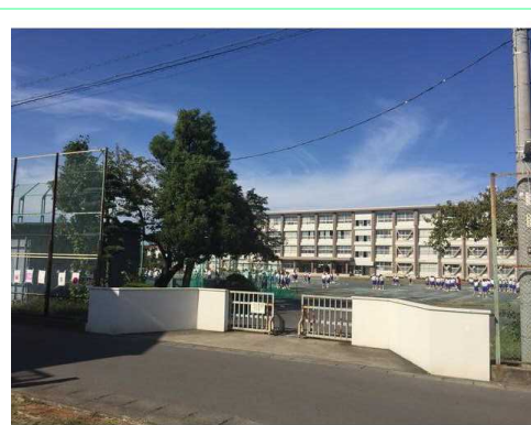
一宮市立千秋中学校