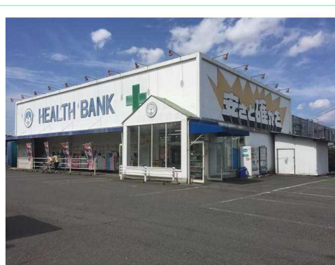
ヘルスバンク千秋店