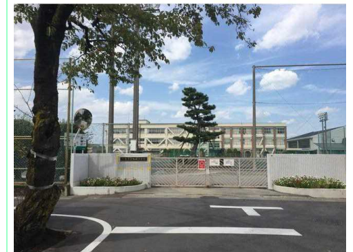
一宮市立南部中学校

※この図面は物件情報の一部を抜粋して掲載しております。(現況優先) ※付帯条件や別途料金が発生する場合がありますのでご確認ください。