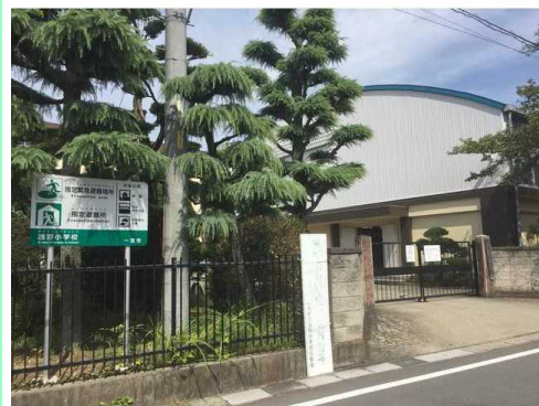
一宮市立浅野小学校