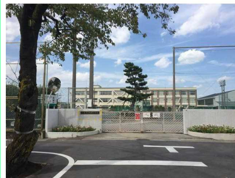
一宮市立南部中学校