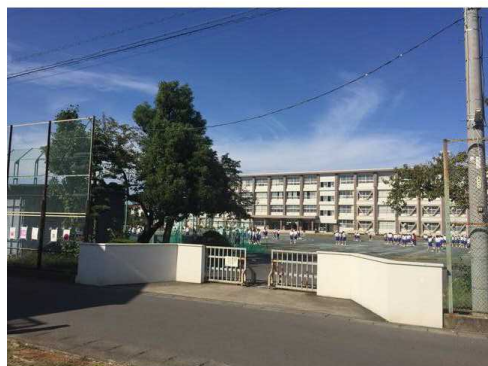
一宮市立千秋中学校