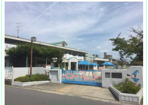
一宮市立浅野保育園

※この図面は物件情報の一部を抜粋して掲載しております。(現況優先) ※付帯条件や別途料金が発生する場合がありますのでご確認ください。