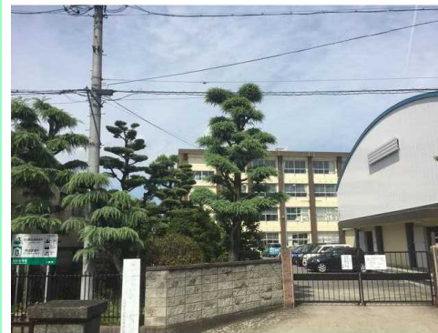
一宮市立浅野小学校