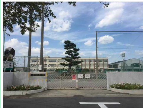
一宮市立南部中学校