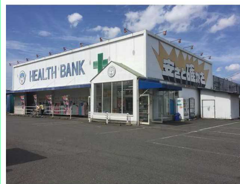
ヘルスバンク千秋店