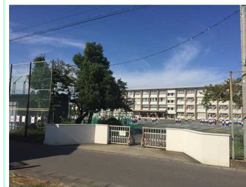
一宮市立千秋中学校

※この図面は物件情報の一部を抜粋して掲載しております。(現況優先) ※付帯条件や別途料金が発生する場合がありますのでご確認ください。